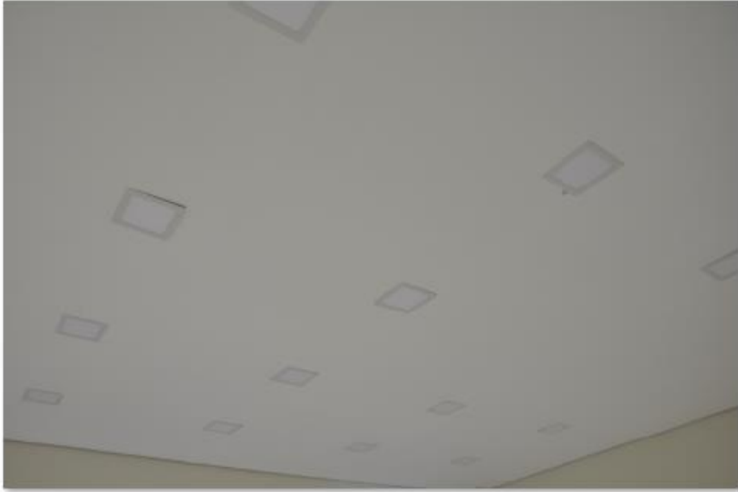
31/10/2017 – Luminárias área do refeitório