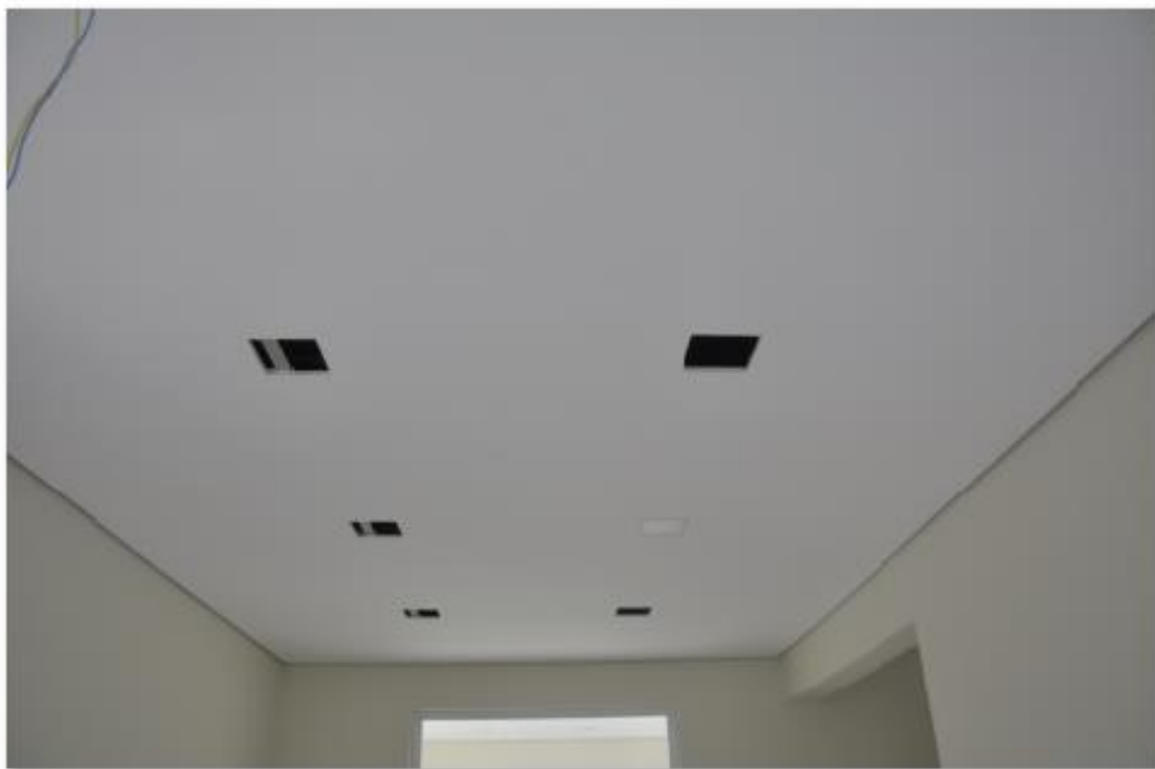
31/10/2017 – Recorte de forro