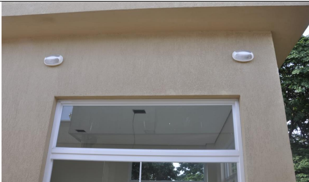
31/10/2017 – Instalação luminárias externas